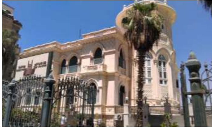
(شكل رقم 2)