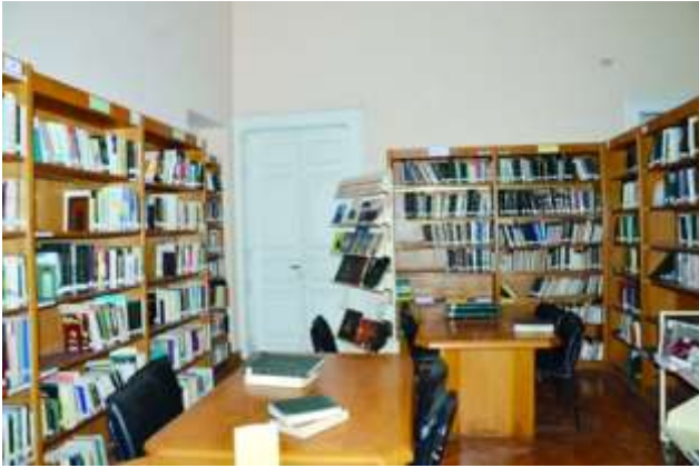
(شكل رقم 6)