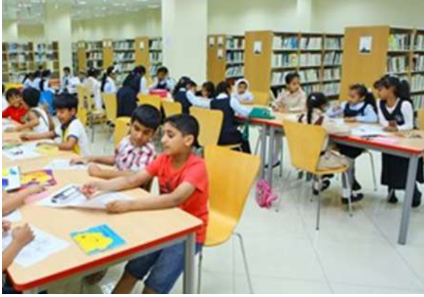
(شكل رقم 4)