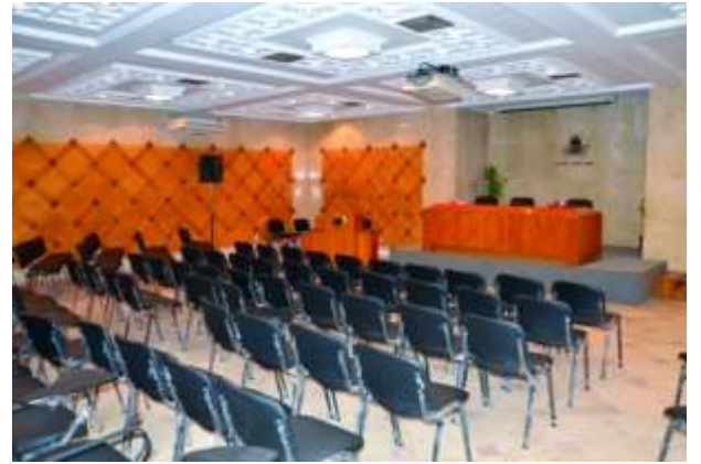
(شكل رقم 5)