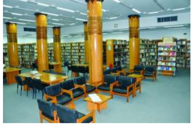
(شكل رقم 3)